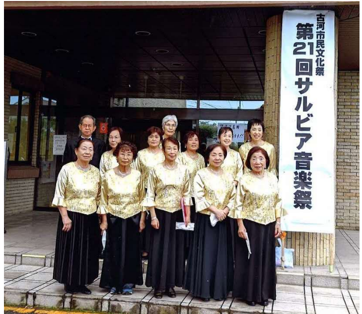
音楽祭の会場にて